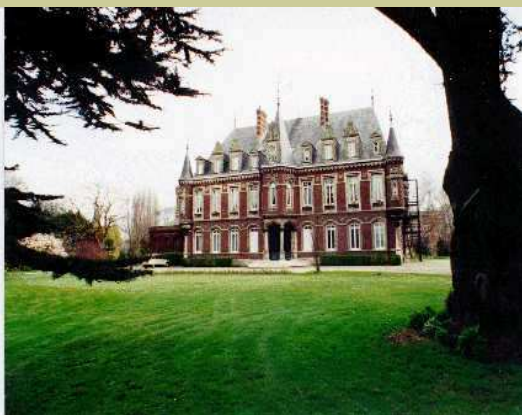
L'administration du lycée Les Bruyères

L'admission s'effectue sur dossier (à préparer cette année), après classement des candidatures.