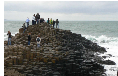
Sortie pédagogique à la chaussée des géants en Irlande en 2008

Un séjour linguistique est organisé au cours de la scolarité au lycée dans un pays de langue anglaise.